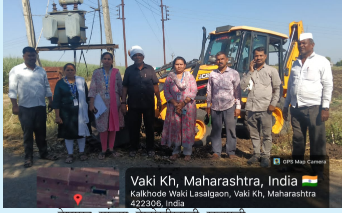
Vaki Kh, Maharashtra, India Kalkhede Waki Lasalgaon, Vaki Kh, Maharashtra 422306, India